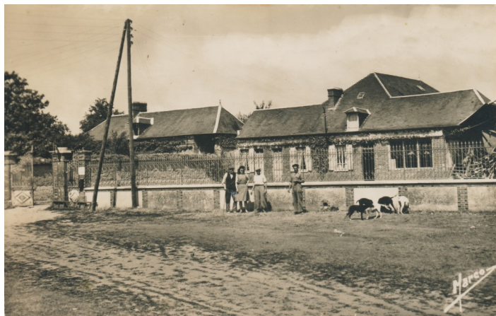
Café Canu en 1949 ou 1950

Ces bâtiments ont été remplacés par les commerces et la crèche. A cette époque il y avait 3 bars dans la commune.