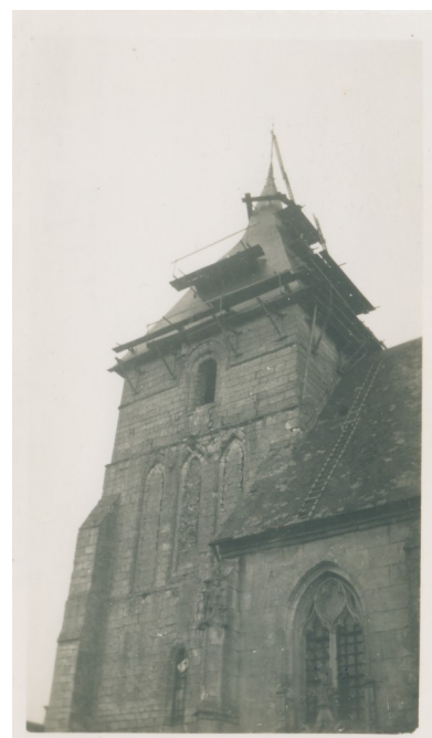
Réparations du clocher et pose de la girouette en 1947 suite aux dégâts provoqués par la foudre