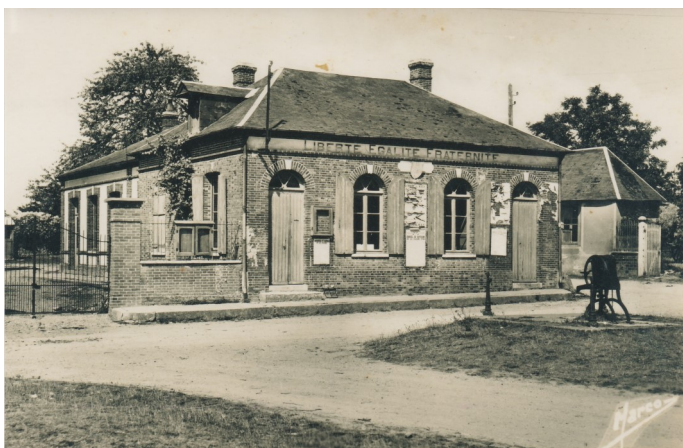
Mairie vers 1945